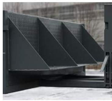
РАЗДВИЖНАЯ БОРТОВАЯ ПЛАТФОРМА