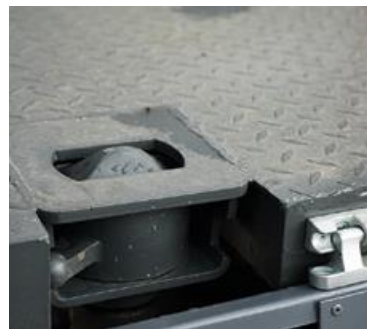
ФИТИНГИ (ТВИСТЛОКИ) ДЛЯ ФИКСАЦИИ МОРСКИХ КОНТЕЙНЕРОВ