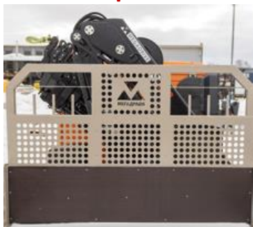
УСИЛЕННЫЙ ПЕРЕДНИЙ ПОРТАЛ