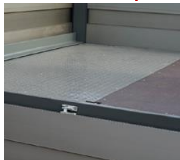
КОМБИНИРОВАННОЕ ИСПОЛНЕНИЕ ПОЛА