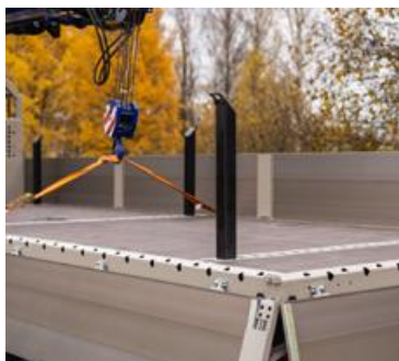
ОГРАНИЧИТЕЛИ СМЕЩЕНИЯ ГРУЗА