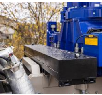
ЯЩИК ДЛЯ ХРАНЕНИЯ ОГРАНИЧИТЕЛЕЙ СМЕЩЕНИЯ ГРУЗА