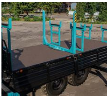
СЪЕМНЫЕ ЛОЖЕМЕНТЫ ДЛЯ ПЕРЕВОЗКИ ОПОР И ПОВОРОТНЫЙ КОНИК