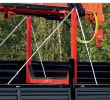
СЪЕМНЫЙ ПОВОРОТНЫЙ КОНИК