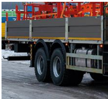
БОРТОВАЯ ПЛАТФОРМА С ЗАНИЖЕННОЙ ПОГРУЗОЧНОЙ ВЫСОТОЙ